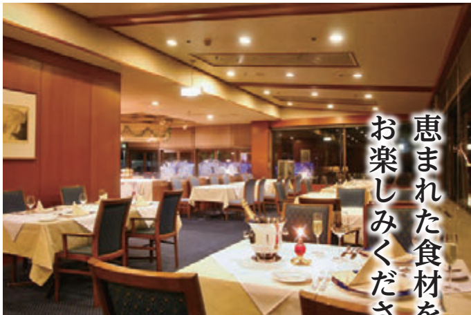
レストラン「ベルビュー」

三陸の旬の魚介類をはじめ、山の幸、里の幸にも恵まれた土地柄を生かし、良質な素材をふんだんに使用したお料理もホテルクレセントの魅力です。