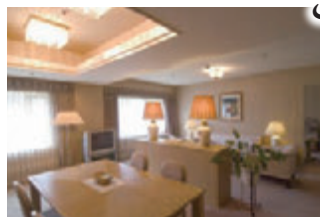
プレデンシャルスイート