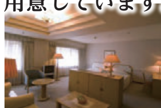
ジュニアスイート

自然に囲まれたリゾートライフをゆったりとお過ごし頂くために、 明るく気品漂う86のゲストルームをご用意しました。 格調とゆとりの「プレデンシャルスイート」をはじめ、 洋室はもちろん、全室が名取川に面した和室もご用意し、 眼下に広がる眺望は、優雅なリゾートのひとつときをお約束します。 また、館内には「一心美術館」もありますので、 日本画を中心とした芸術の世界で、心からゆったりと お過ごしください。