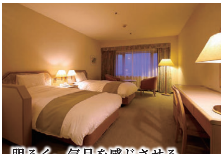
デラックスツイン

ホテルクレセントの温泉は、 地下800mから湧き出る源泉を使用しています。 肌ざわりが柔らかく、体の芯から温まる天然温泉です。 人気のジャグジーバスも備えていますので、 心身ともにリラックスしていただけます。 大きな窓から森の木々や満天の星空をあおぎながら、 リゾートならではの開放感を心ゆくまでお楽しみください。