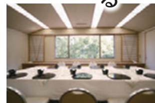
アイリス・フリージア