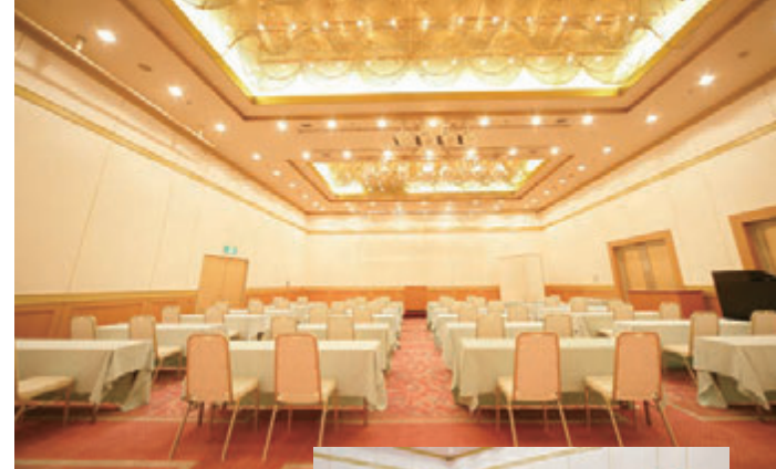
ボールルーム「コスモス」