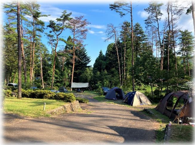
Aサイト (ウッドチップ・)